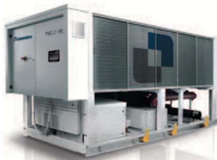
Рис. 5. Climaveneta TECS-FC/K