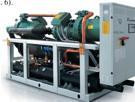
Рис. 6. Climaveneta FOCS2-W/CA/H