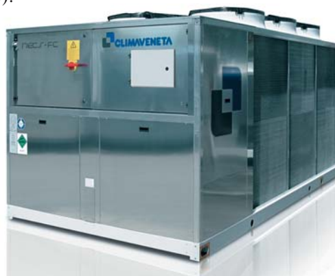
Рис. 3. Climaveneta NECS-FC /B