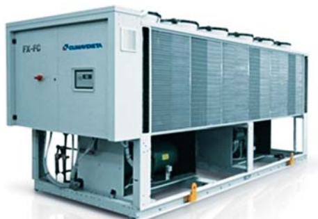
Рис. 4. Climaveneta FX-FC/T+